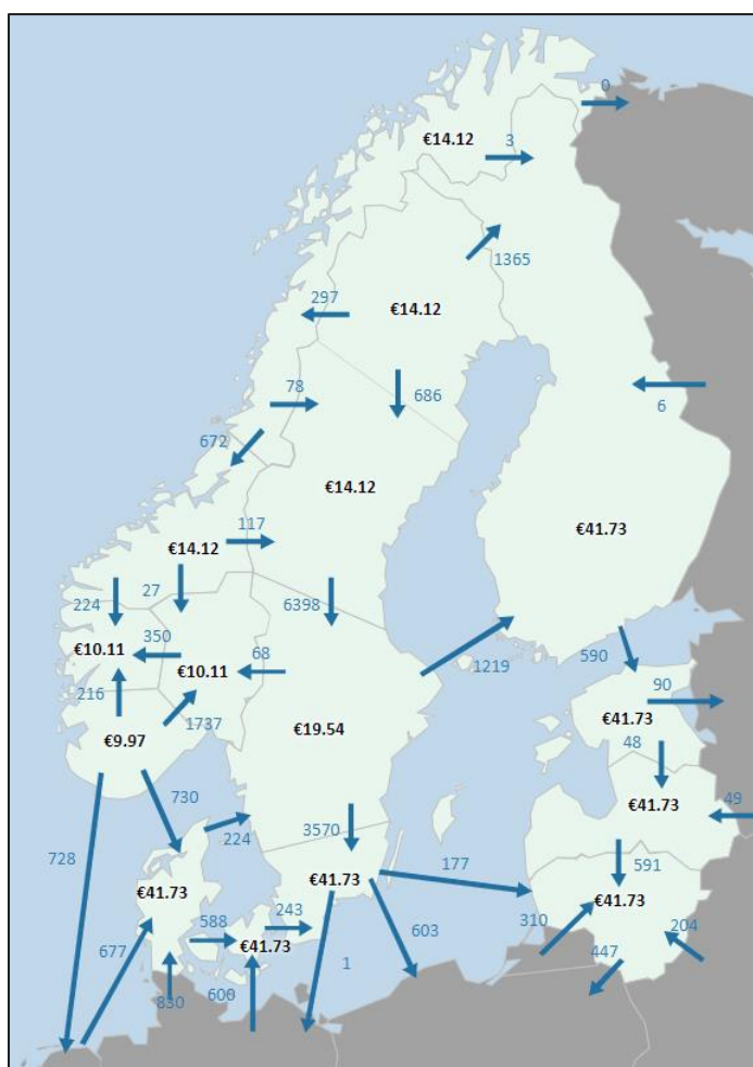
Elutbytet i det nordiska elsystemet. Bilden visar situationen den 3 mars 2020, kl 17.30. 68

En ökad vindkraftsproduktion i Sverige, och en ökad elexport, ersätter alltså fossil elproduktion i Europa, vilket ger omfattande klimatnytta. Det handlar både om strukturella förändringar och om omedelbar undanträngning i elsystemet.